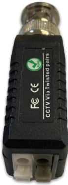
1. Kamera oldali balun trafó